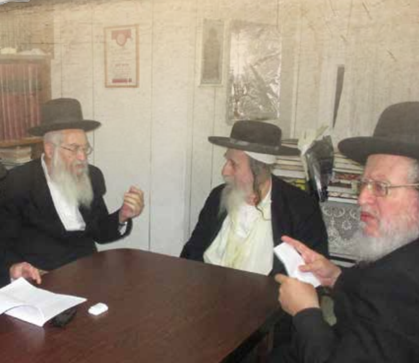
אנשי שלומינו במירון יחד עם ר' לוי יצחק